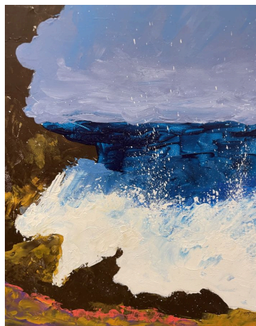
Brigitte Koessler - Grosse Mer

🎸 Une affiche pour la présentation du groupe de musique 2Cé3B